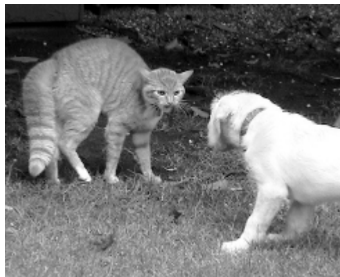
“U” invertido e cauda em espanador. - Adaptado de: Bowen et al., 2005, Behaviour Problems In Small Animals

Todos conhecemos a cauda “em espanador”. Esta está associada a medo ou defesa. Por outro lado a cauda no ar mas relaxada diz-nos que o gato está amistoso ou a pedir carinho e é quase sempre seguida de um toque no nariz do outro gato ou um roçar do corpo no dono. Movimentos rápidos da cauda indicam que o gato está agitado. Quando a cauda toma a forma côncava ou junta às patas traseiras indica um estado agressivo.